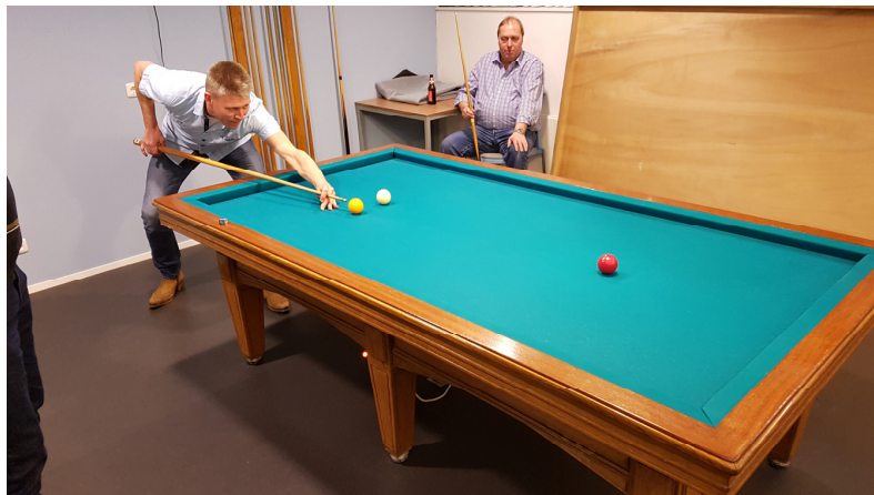
De afstoot van de beslissingspartij (dit leverde overigens geen carambole op)